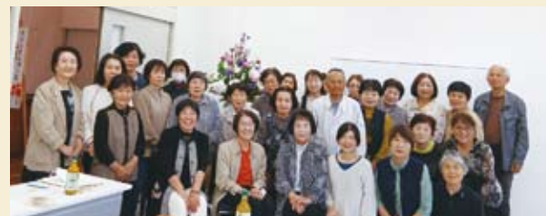
千歳町ボランティア連絡協議会員の皆さん